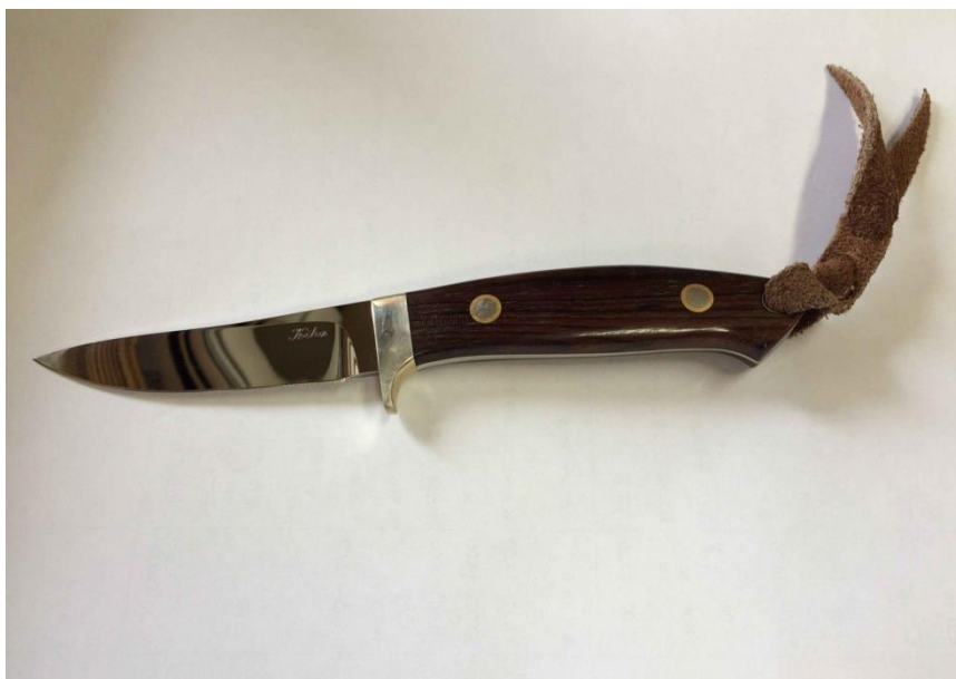
Первый нож, изготовленный мастером Кикую Матсуда