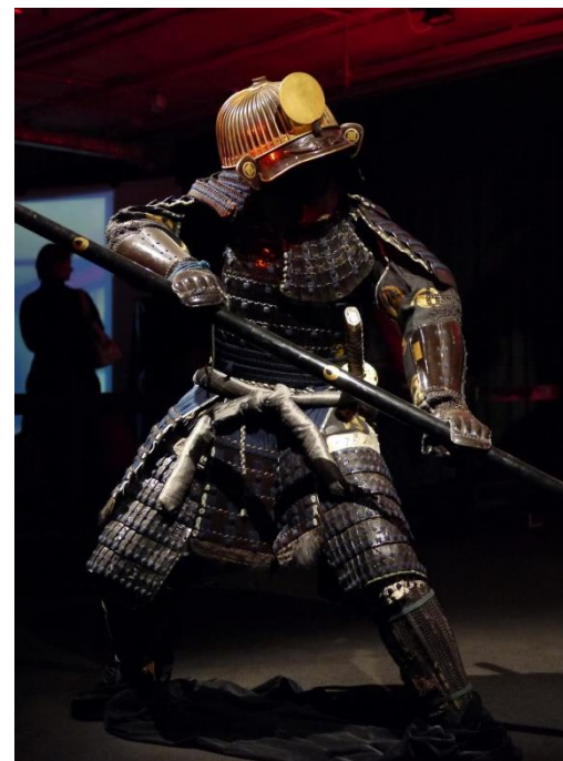
Реконструкция Битвы при Сэкигахара, экспозиция Art of War