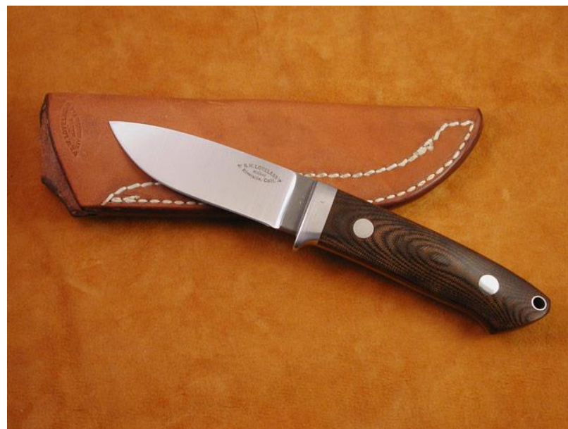
Источник вдохновения – ножи Роберта Лавлесса

На первых этапах Матсуда-сан вдохновлялся работами известного американского ножедела Роберта Лавлесса, но быстро обретя собственный неповторимый стиль, стал делать узнаваемые клинки, которые невозможно спутать с чьими-либо еще.